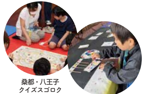
桑都・八王子クイズスゴロク